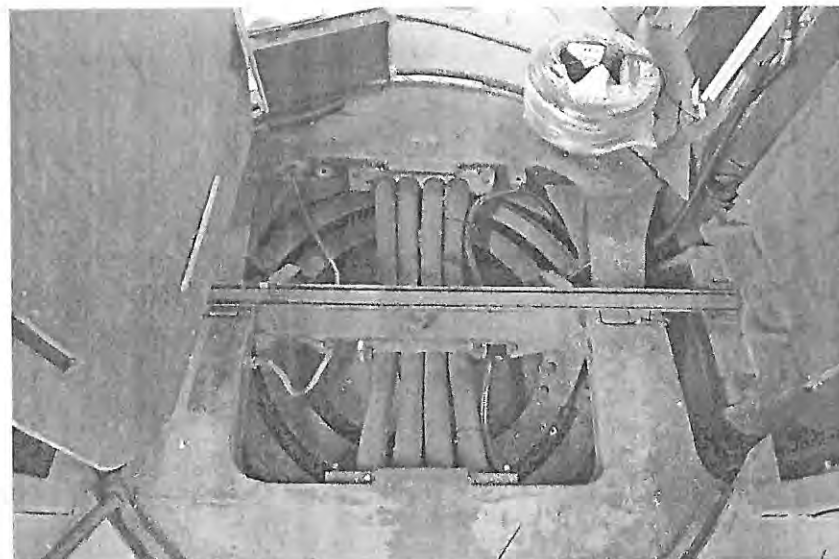
Kuva 2 Kaapelivarausten vetoa nivelen yli. sopivien tietoliikennekaapeleiden löytäminen oli haastavaa.