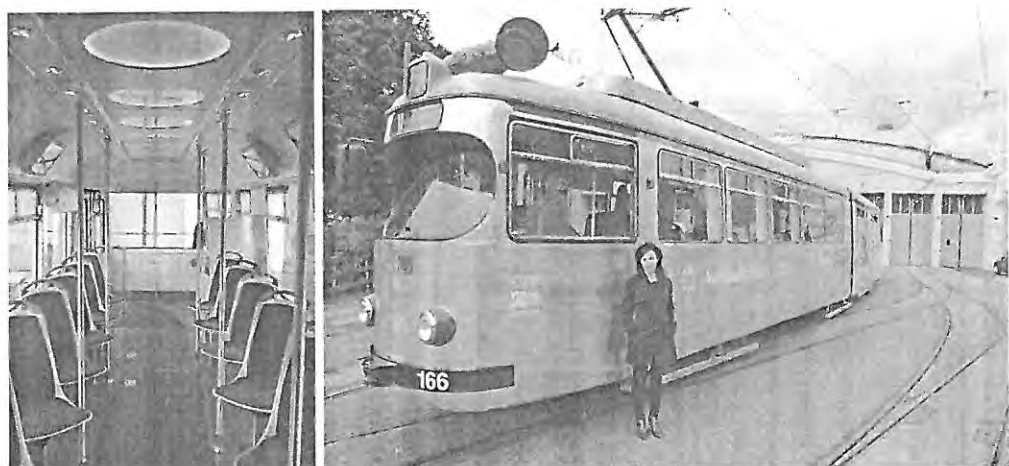
Kuva 6 Valmis vaunu on näyttävä sekä sisältä että ulkoa.