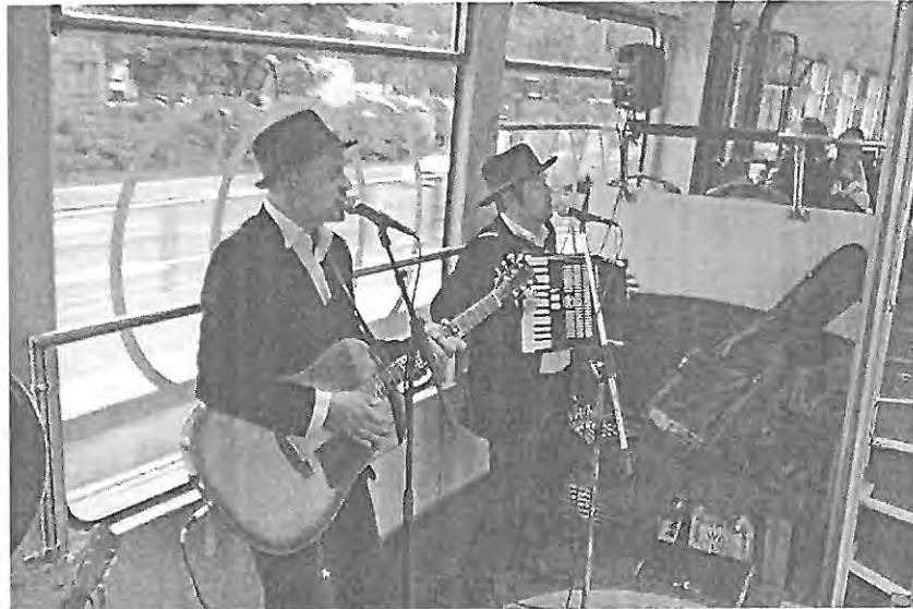
Kuva 5 Kahden miehen orkesteri esiintyy matalassa väliosassa sijaitsevalla keskilavalla.

HSL / Joukkoliikennesuunnitteluosasto kehittämisyhmän päällikkö Kerkko Vanhanen