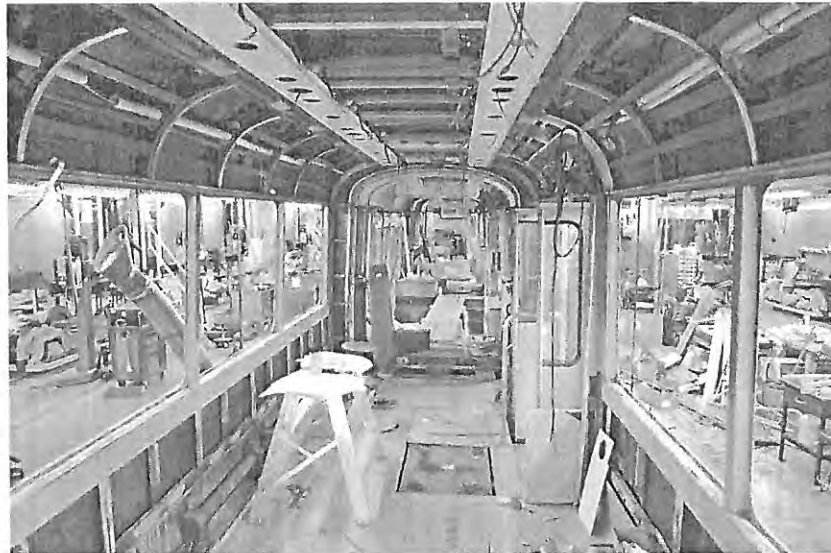
Kuva 1 Sisäkaton rakentamista ja rungon kunnostusta. Sisäkaton rakentaminen oli ennakoitua vaativampi projekti.